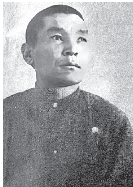
Мұхтар ҚҰЛ-МҰХАММЕД, Ұлттық ғылым академиясының академигі

Мемлекет басшысы Геннадий Головкинді Халықаралық бокс федерациясы (World Boxing) Олимпиада комиссиясының төрағасы болып тағайындалуымен құттықтады.